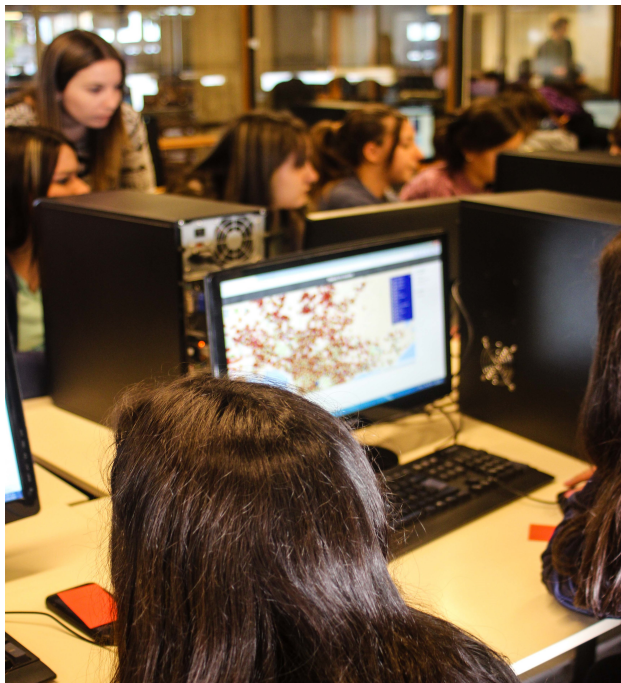
Fig. 4. Niñas realizando el taller Mapeá tu mundo

algunos grupos en donde la asistencia lo permitía varios docentes de secundaria realizaron también la propuesta práctica. En la Figura 4 se puede ver una imagen ilustrativa del trabajo en el taller.