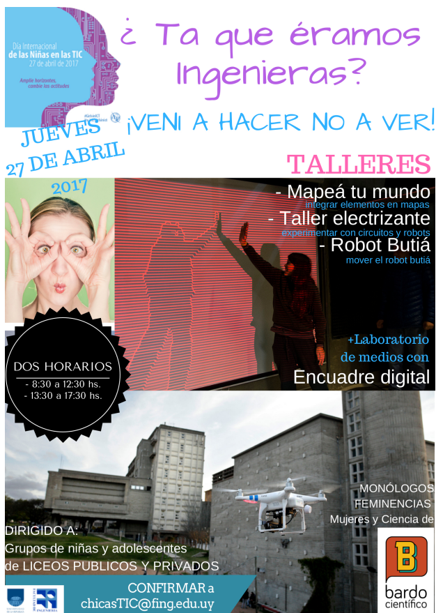
Fig. 1. Afiche de difusión de la Jornada Niñas en las TICs 2017

El grupo de organización de la jornada 2017 estuvo integrado, al igual que en 2016, con varias docentes de los Institutos de Computación y Eléctrica, quienes decidieron cambiar el foco de las actividades que se habían realizando en años anteriores y adoptar la consigna de “hacer en lugar de ver”, como forma de motivar a las participantes. Las actividades se diseñaron para que las adolescentes pudieran conocer e interactuar con ingenieras que trabajan como docentes e investigadoras en el área, siguiendo el enfoque de “role model” en la realización de las actividades. En este sentido, los talleres serían dictados por docentes mujeres del área, y las actividades de la jornada en general serían realizadas por docentes mujeres de ambos institutos, y estudiantes avanzadas de las carreras. En la Figura 1 se muestra el afiche de difusión de la Jornada.